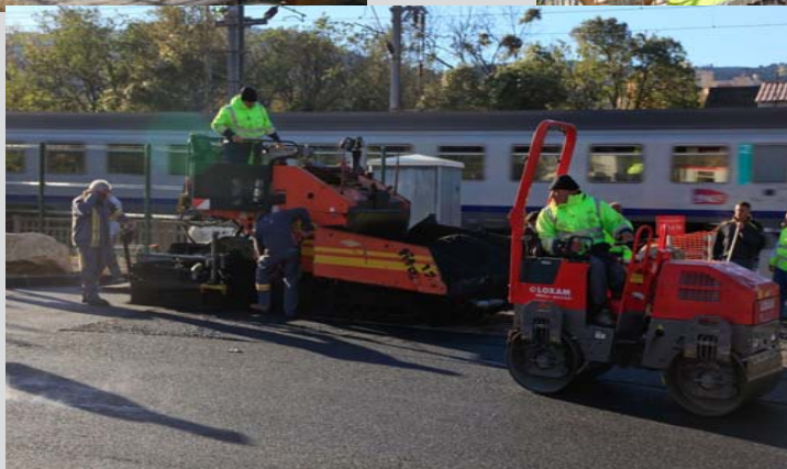
Travaux de voiries