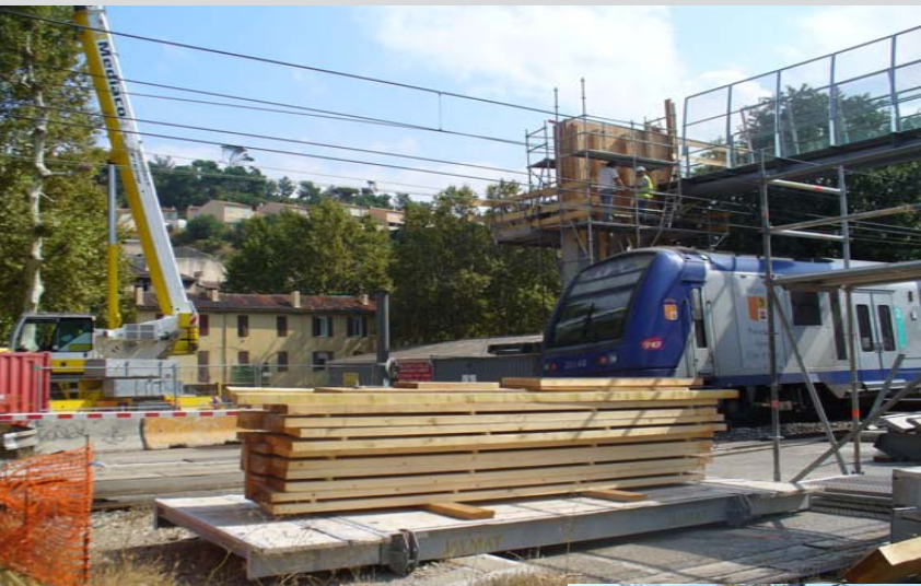
Réalisation de passerelle