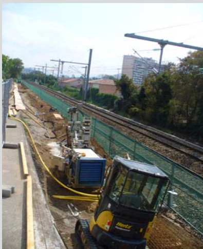
Mur Bd Netty