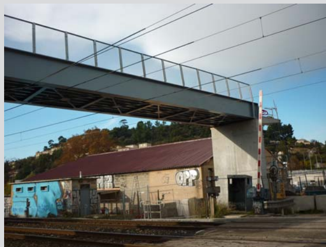
Passerelle Traverse de La Planche (suppression du PN2) Traversées de part et d'autre de la voie ferrée