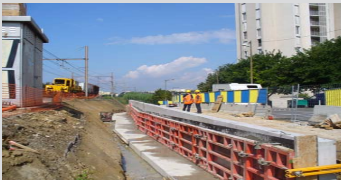
Mur secteur Air Bel